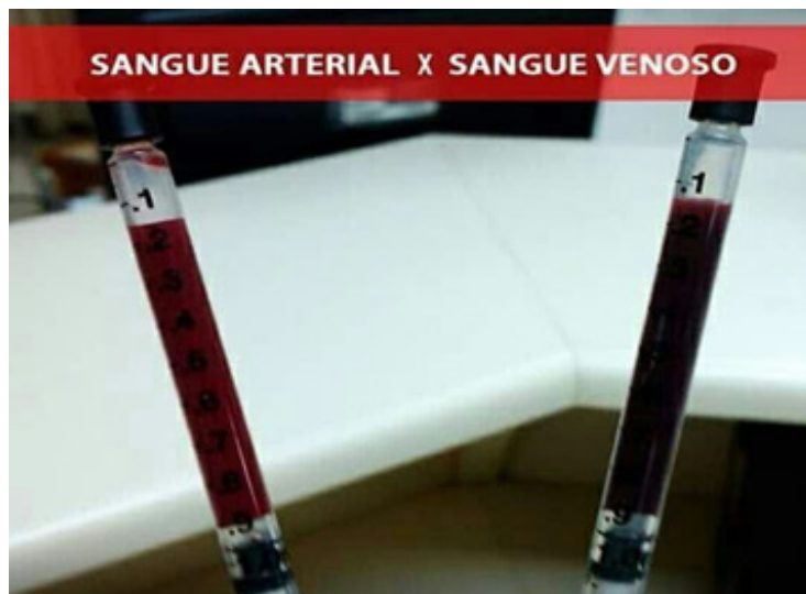
Figura 02: Diferença entre o sangue arterial e venoso, (Fonte: RIBEIRO, AGUIAR 2008).

A maior diferença de um para o outro é o fato de um ser carregado de oxigênio e o outro não, o que o influencia até mesmo em sua coloração, como pode ser verificado na figura 02 onde o sangue arterial é mais claro do que o venoso, esta diferença é definida pelo o processo de hematose que ocorre no pulmão, órgão pertencente ao sistema respiratório, que juntos entre a pequena e grande circulação fazem o processo de trocas gasosas, (LOPES, 2019).