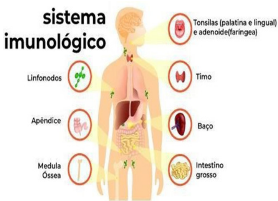
Figura 03: Ilustração dos órgãos que compõem o sistema imunológico, (MUNIZ,2020).

óssea através das células tronco (SOUZA, 2014).