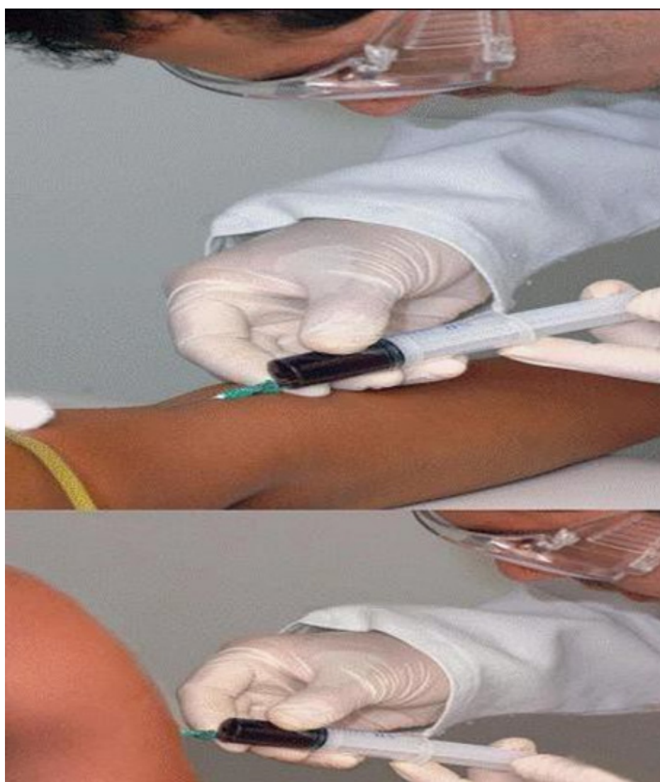
Figura 04: Realização do procedimento Auto Hemoterapia, (Fonte: BRANDÃO, 2007).

A auto hemoterapia é um procedimento simples e de baixo custo, porém sem comprovação científica legal, no entanto há indícios vivenciados por seus praticantes que há efeito terapêutico, a princípio foi utilizada para aumentar a resposta imune e posteriormente no tratamento de diversas patologias, como esta demonstrado na figura 04, (MASSUD, 2007).