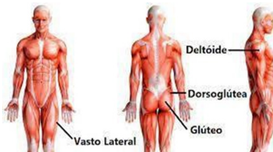
Figura 05: Músculos para aplicação da Auto Hemoterapia, (NETTER,2012).

O procedimento se consiste em retirar de 3 à 20 milímetros de sangue venoso do paciente e aplicar novamente no mesmo, por via intramuscular, quando a quantidade de sangue ultrapassa 5 milímetros, à necessidade de dividir a aplicação em diferentes músculos, normalmente deltoide, glúteo e vasto lateral da coxa, divisão ilustrada na figura 05,(COREN SP, 2010).