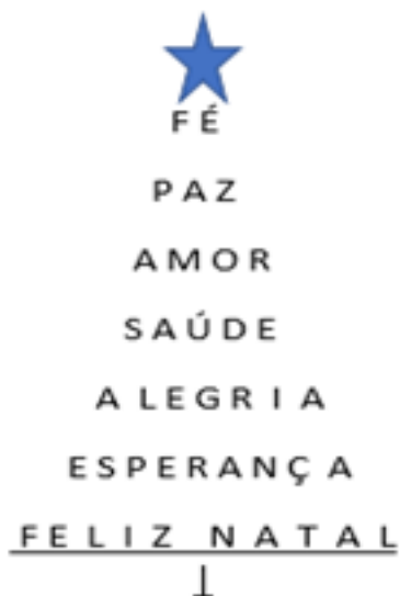
Figura 2: Planejamento da confecção da árvore de Natal.

de natal formada com palavras positivas. As palavras foram levadas pelo grupo, em material emborrachado, verde com brilho. Começamos pela base, com o básico FELIZ NATAL, em seguida, cada um de nós construiu a árvore, explicando o porquê de cada palavra e partilhando o desejo a cada um.