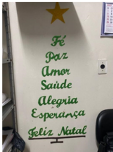
Figura 3: a árvore após a prática ficou fixada na parede da sala.

Em seguida, fizemos uma imitação do Programa “Qual é a música?” do canal televisivo SBT e apresentado pelo comunicador Silvio Santos. A dinâmica consistiu em ouvir apenas a melodia da canção e, como tarefa, dizer qual a música ou qual o cantor. Esse momento propiciou ao grupo a percepção do quanto a música é relevante para a saúde mental, não importando ritmo, melodia e harmonia, mas sim como ela atua no sistema nervoso. Conforme cita Octaviano (2010):