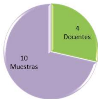
Ilustración 1 Muestras