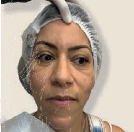
Figura 2 – Pós imediato fios faciais