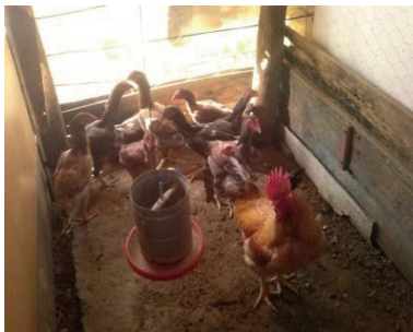
Figura 1 Box 1 de galinhas poedeiras alimentadas com Milho

No que se refere ao milho, foi colocado no período de 24 horas, 2 Kg sendo dividido em duas partes ao dia 1Kg pela manhã e 1 Kg pela tarde, não contendo sobra, incluindo alimentos alternativos.