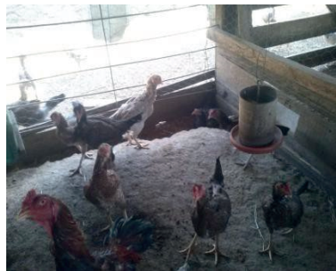
Figura 2 Box 2 de galinhas poedeiras alimentadas com Milheto