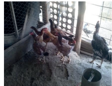
Figura 3 Box 3 de galinhas poedeiras alimentadas com Gérmen de Milho