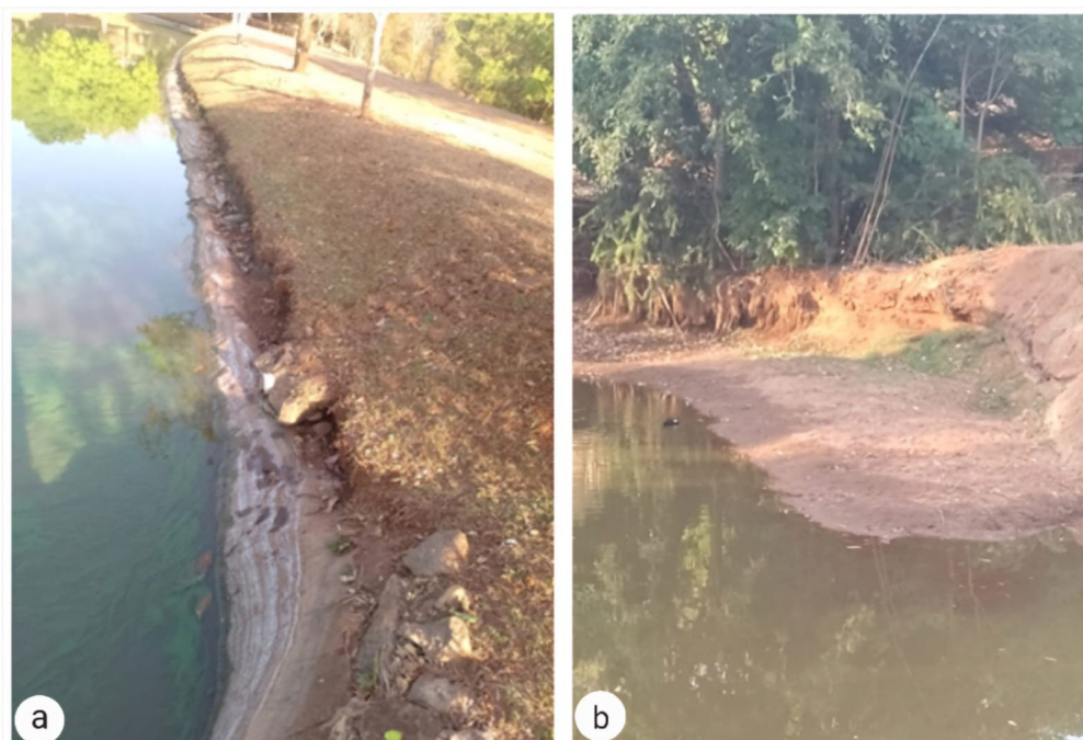
Figura 04 – Patologia observadas nas margens das barragens 01 (a), 02 (b)

Foi detectado um problema de assoreamento na Barragem 01, causado pelo transporte de sedimentos, como solo, provenientes das manilhas de água pluvial do residencial. Esse fenômeno ocorre devido ao escoamento das chuvas, que arrasta partículas de solo para os corpos d'água. O assoreamento diminui a capacidade de armazenamento desses corpos, aumentando o risco de enchentes, prejudicando o ecossistema aquático e danificando as infraestruturas hidráulicas adjacentes.