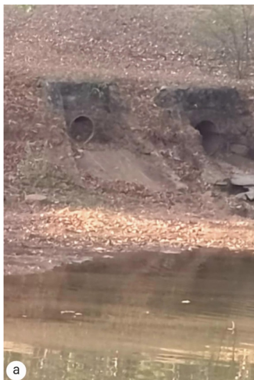
Figura 05 – manilhas: água pluvial vem com solo, assoreando o lago 02 (a)