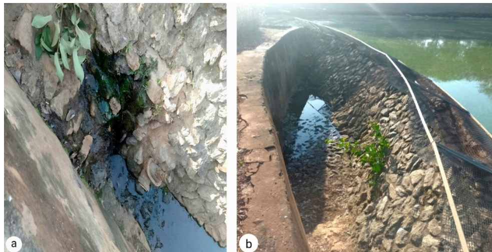
Figura 06 – Perda de água no Lago 02 devido a lona deteriorada (a) Local com falta de sinalização (b)

Também foram feitas algumas observações: