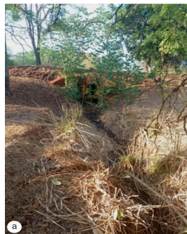
Figura 03: Presença de vegetação, detritos e resíduos no canal de entrada no lago 2 (a)

Foi detectado um problema de erosão costeira nas barragens 01 e 02. Esse fenômeno pode ser causado por diversos fatores, como a ação das ondas, a correnteza, as flutuações no nível da água e a exposição a condições climáticas adversas. A erosão costeira pode ter consequências sérias para a estabilidade das margens do lago, incluindo deslizamentos de terra, perda de solo e, em situações mais graves, a criação de novas crateras ou cavidades nas margens.