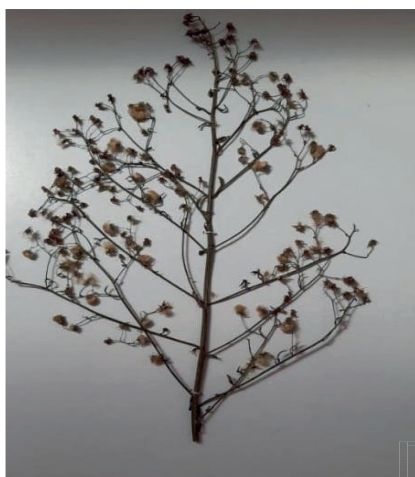
Figura 4- Planta C. canadensis . L. (1763). Elaboração dos autores. (2019).