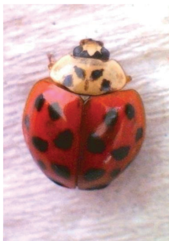
Figura 2- Harmonia axyridis Pallas (1773).