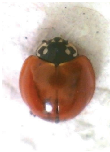
Figura 1- Cycloneda sanguinea L. (1763).

proporcionam uma maior longevidade, fecundidade e melhor desenvolvimento (RODRIGUES, 2004).