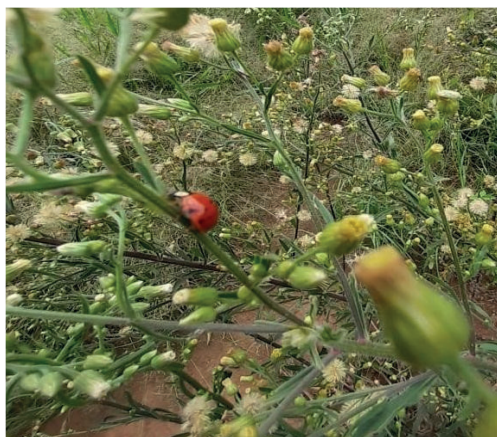
Figura 6- A espécie Harmonia axyridis na planta C. canadensis . Figura 5-