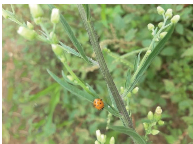
Figura 5- A espécie Hippodamia convergens na planta C. canadensis .