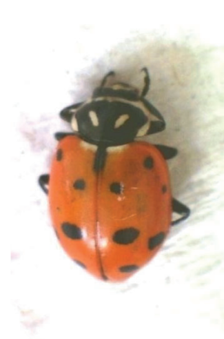
Figura 3- Hippodamia convergens Guerin-Meneville (1842).