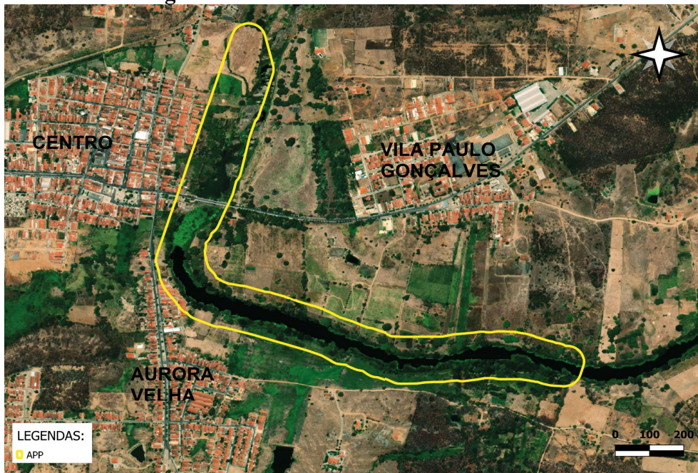
Figura 04. APP da área de estudo e os bairros

O Rio Salgado é um importante meio econômico e social regional, que cruza o centro da cidade de Aurora, com margens compostas por ruas e bairros, como Centro e Aurora Velha, localizados do lado esquerdo do rio e a Vila Paulo Gonçalves, ao lado direito. Interligados e não interligados pela ponte sobre o curso d'água (figura 04).