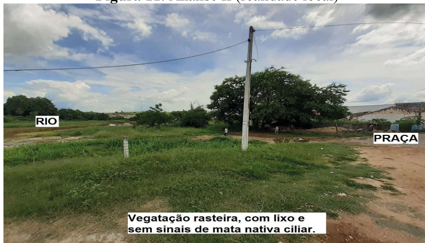
Figura 11. Análise II (realidade local)

lização por animais, relacionado ao estresse local, poluição sonora, luminosa, hídrica e social, conforme exposto anteriormente e em seguida nas figuras 11 e 12.