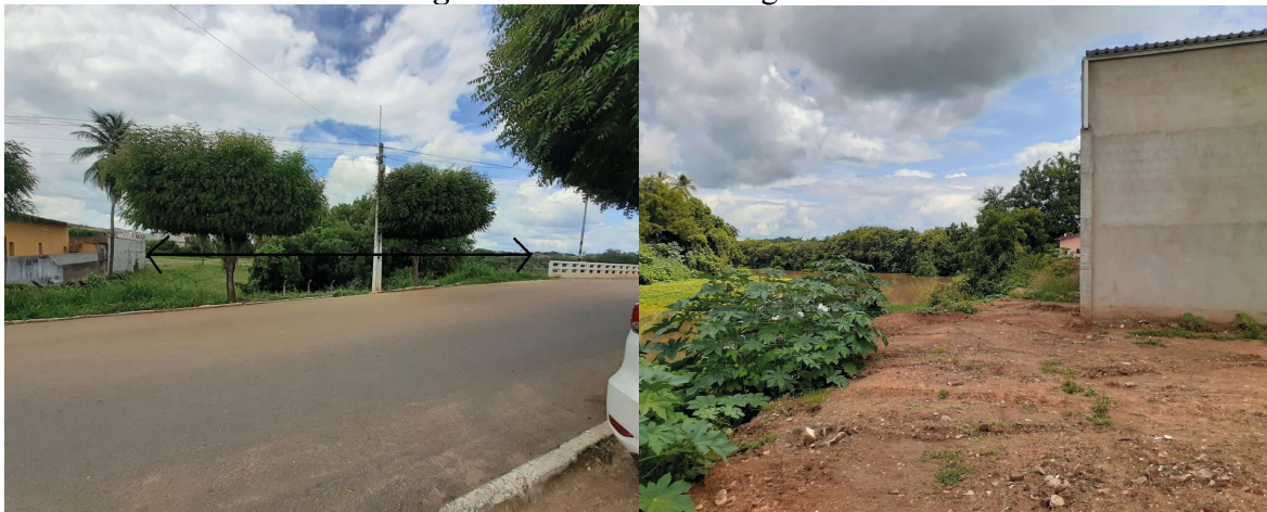
Figura 12. Casas nas margens do rio