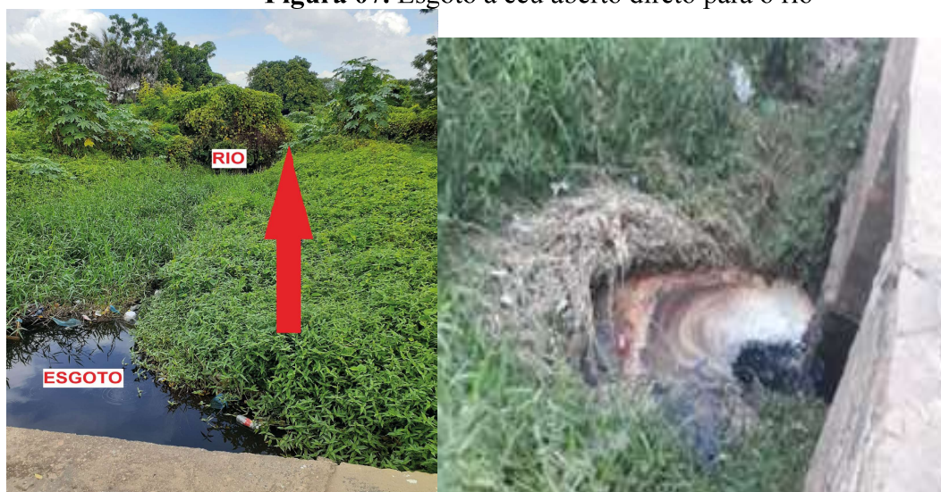
Figura 07. Esgoto a céu aberto direto para o rio

em questão, desenvolvido pela ARCE (Agência Reguladora do Estado do Ceará), a cidade apresenta no Índice de Atendimento Urbano de Esgoto, nos anos de 2017 a 2020, o rótulo vermelho (ruim), compreendendo valor unitário de 14,9%. Bem como a falta de tratamento adequado e quantitativo de esgoto, assim como serviços de saneamento básico e locais alternativos e planejados, provocam o despejo dos resíduos líquidos no rio salgado e conseqüentemente sua contaminação.