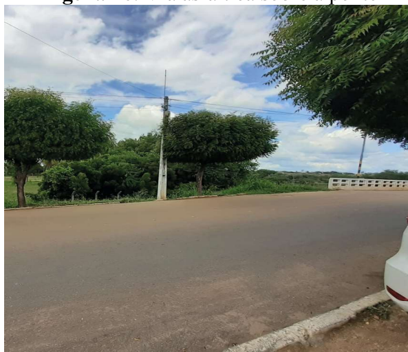
Figura 10. Via asfáltica sobre a ponte