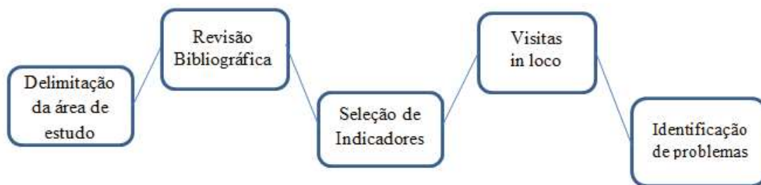
Figura 03. Fluxograma metodológico