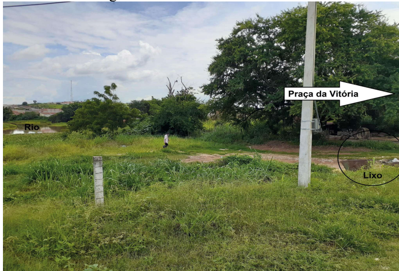
Figura 06. Análise da realidade local