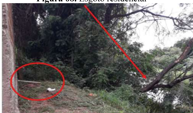
Figura 08. Esgoto residencial